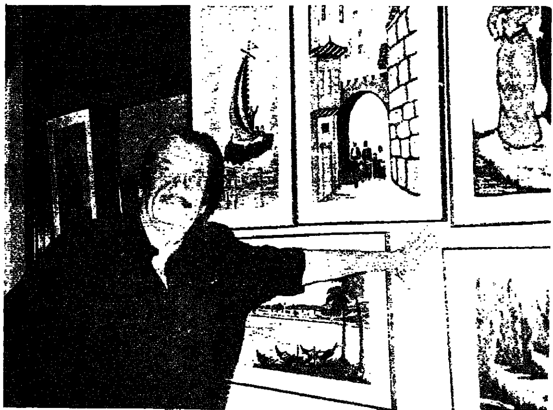
الرسم وعقله ابن الكلبوس والتجربة

يا انت الحرة في نفسها المنطقه، يا انت القلب المصني البطاه قريبي من دموعي لاصرخ قريبي من بلادي لاحيا فالغيوم كثيرة هنا والغياب يقرب ايها الحبيبة. يا انت الحرة في نفسها المنطقه، يا انت القلب المصني البطاه قريبي من دموعي لاصرخ قريبي من بلادي لاحيا فالغيوم كثيرة هنا والغياب يقرب ايها الحبيبة.